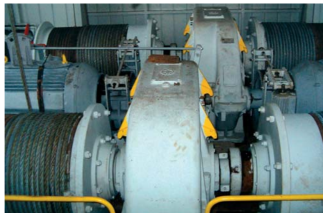
Zdvihovalé motory, brzdy s prevodovkami a navijacími bubnami

V tomto článku sa zameriame hlavne na pohon dvojitého zdvihu žeriava, nakoľko si jeho riešenie vyžadovalo niekoľko inovátnych riešení. Ide o dva rovnaké zdvihy s motormi 100 kW, ktoré cez prevodovky poháňajú navijacie bubny na dve samostatné laná. Tie prechádzajú