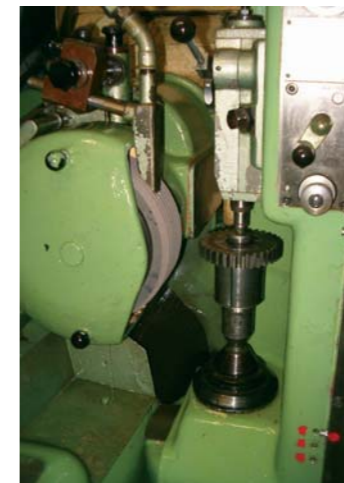
Regulácia brúsky ozubených kolies s riešením VONSCH

Viete, že ak pracuje viac pohonov na jednom zariadení a medzi pohonmi je mechanická interakcia (navijáčky, spriahnuté pohony, rôzne valcovacie stolice) alebo pracujú v striedavých režimoch motor/generátor (skupina výťahov v jednej strojovni), je z hľadiska spotreby elektrickej energie výhodné v rozvážači poprepájať medzi meničmi jednosmerné medziobvody? Generovaná energia sa automaticky presúva do pohonov v motorickom režime prevádzky a o to menej sa spotrebúva z napájacej sústavy. Technické detaily konzultujte so servisnými pracovníkmi VONSCH. Takéto riešenie použili inžinieri VONSCH pri regulácii navijacích strojov v papierenskom priemysle a pri regulácii brúsky ozubených kolies v strojárskom priemysle.