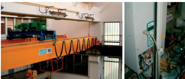
Obr.3 Regulácia pojazdu nového 16 t žeriava pomocou FM VQFREM 400 110 (400 V, 110 kW)

V súčasnosti pracujú vývojoví pracovníci VONSCH v oblasti žeriavovej techniky aj na aplikovaní požiadaviek normy EN 954, kat. 3 – bezpečné vypnutie. Funkcia bezpečného vypnutia zabraňuje meniču frekvencie vytvárať v motore krútiaci moment. Túto funkciu možno zahrnúť do systému bezpečnosti celého stroja – možno ju použiť aj ako bežne používaný vstup blokovania prevádzky pohonu. Bežné riešenie je, keď štandardný menič frekvencie, ktorý nemá hardvérové obvody bezpečného vypnutia, musí byť pre splnenie bezpečného vypnutia podľa kategórie 3 zapojený tak, že za ním je zapojený stykač, ktorý bezpečne odpojí motor od meniča frekvencie. Nové riešenie VONSCH bude mať funkciu bezpečnostného vypnutia, ktorá zabraňuje vytváraniu momentu motora, pokiaľ správne nepracujú všetky obvody meniča. Táto funkcia blokuje spínanie výkonových tranzistorov v striedači meniča. Blokovanie musí byť urobené tak, aby všetky možné poruchy vo výkonnej časti meniča mali za následok stratu krútiaceho momentu motora – je zabránené točeniu motora.